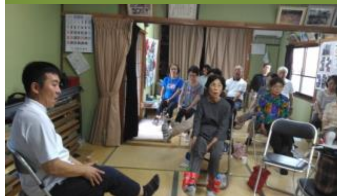
「Go・郷まつむね」 介護予防・日常生活支援総合事業